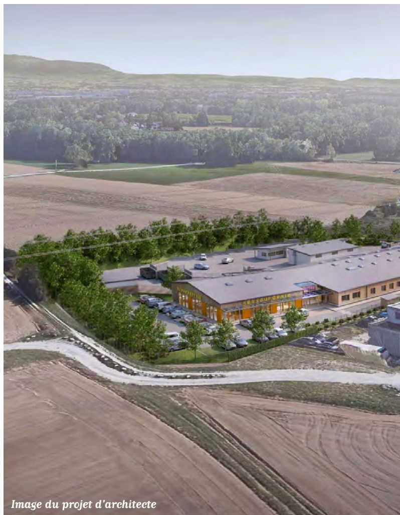
Image du projet d'architecte

La gestion de la ressourcerie sera assurée par délégation de service public réservée à une structure d'insertion par l'activité économique. Deux structures sont candidates; l'attribution de l'exploitation du site sera connue à la fin du mois de mai.