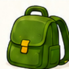
Sac à dos